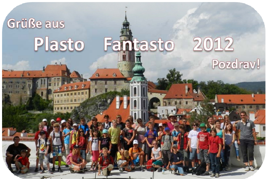
Postkarte aus Český Krumlov: Grüße aus Plasto Fantasto 2012!

können. Und die Moral von Märchen prägt unsere Werte und Vorstellungen. Auch die Unterschiede und Gemeinsamkeiten in tschechischen und deutschen Versionen der selben Märchen entdeckten wir. Aber vor allem wurden Märchen erzählt, gelesen und errätselt. Überraschend war, wie fasziniert doch ausnahmslos alle Teilnehmer von diesen Märchen waren.