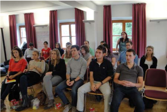
Das 7. Deutsch-tschechische Forum tagt zum ersten Mal

Am 01. September 2012 nahm das 7. Deutsch-tschechische Jugendforum seine Arbeit auf