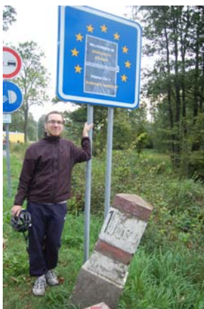
Ein müder Radler be- zwingt die böhmisch- ägyptische Grenze

„Aber vielleicht ist die Zeit noch nicht reif dafür, und so wird er nicht müde werden, der heilige Herzog von Böhmen, dass er für beide betet, die Weishäuptls und die Bělohlaveks, damit sie nicht eines Tages sich gegenseitig ins Unglück bringen samt ihren Völkern. – Und wenn sie es dennoch tun sollten, möge der liebe Herrgott in seinem Ratschluss es fügen, dass wenigstens hinterher, wenn das Unheil an ihnen allen bereits geschehen ist, sie den Weg zueinander finden und ein für allemal ihren Frieden machen auf dieser Welt.“