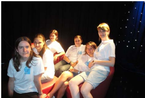
Der AG Kultur nach dem gelungenen Kurzfilmabend in Regensburg

schließlich einer 12-stündigen Bier-Tour durch die besten Kneipen der Stadt, zwei deutsch-tschechische Kurzfilmabende in Regensburg und Pilsen ebenso wie länder- und zugleich generationenübergreifende Stadtführungen in einer deutschen und tschechischen Stadt im Erzgebirge. Die Mitglieder der AG Czech in! führten Präsentationen an deutschen Schulen im Grenzgebiet durch, um junge Menschen zu ermutigen Austauschmöglichkeiten ins Nachbarland zu nutzen, also in Tschechien „einzuchecken“.