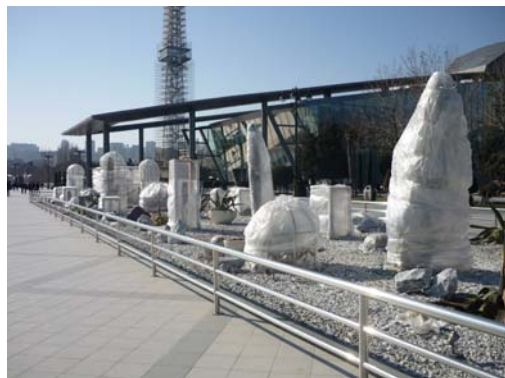
Die Stadt putzt sich heraus für die Augen Europas

Es ist erstaunlich, wie in einem Land, das sich Europa zugehörig fühlen möchte, diese für uns selbstverständlichen Grundrechte nicht anerkannt werden. Wie man Teilnehmer oder gar Ausrichter eines Menschen und Nationen verbindenden „Songwettbewerb“ sein kann, aber dem eigenen Volk mehr Schaden zufügt als Gutes tut. Wie der Rest Europas das zu großen Teilen akzeptiert und in den fröhlichen Singsang miteinstimmt, als wäre die Welt nur Friede, Freude und ESC. Mit diesen Gedanken sitze ich nach fast drei Monaten im Flugzeug zurück nach Berlin. Ich bin froh, bald wieder daheim zu sein. Die Zeit in Baku hat mich stark geprägt und erschüttert. Im Gepäck habe ich viele Eindrücke und Erfahrungen, aber auch die Hoffnung, dass dieses kleine Land im Kaukasus bald so leben kann, wie die Bewohner es sich wünschen. Euer Holle