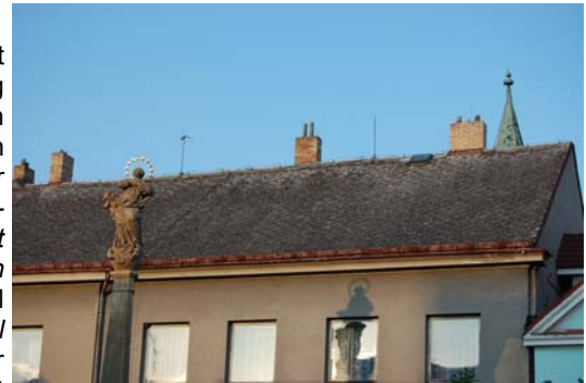
Böhmen zeigt sich auch von seiner heiligsten Seite