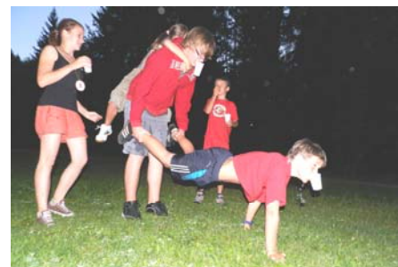
Hoch motivierte Teilnehmer

gesungen. Am Ende kam ein glamouröses Musical mit Hänsel und Gretel auf die Bühne. Es folgten eine Messe, die Eröffnung der erweiterten Ausstellung „15 Jahre Plasto Fantasto“ und ein wunderbar vom Haus erdachtes und geschmücktes Buffet. Alles mündete am Schluss in die obligatorische JA-Party. Hier wurden Briefe geschrieben, Spiele gespielt und getanzt, getanzt, getanzt.