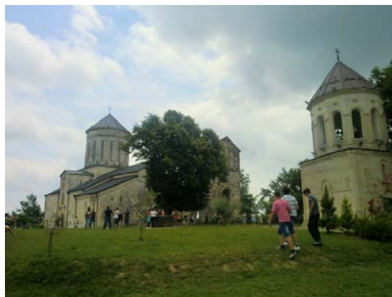
Vielbesuchte Klosteranlage Martwili

noch) Schritt für Schritt die Umgangsformen und sozialen Verhaltensweisen der Georgier zu