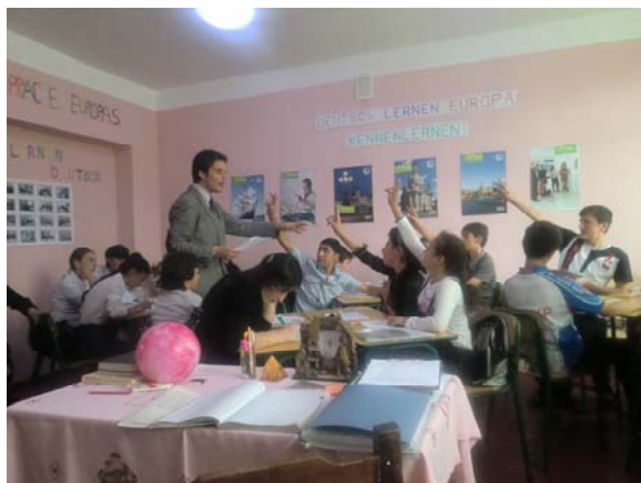
„Deutsch lernen – Europa kennenlernen“

zählende Ort wurde im georgischen Bürgerkrieg in den neunziger Jahren hart getroffen, das Leben ist von großer Armut und hoher Arbeits- wie Perspektivlosigkeit geprägt. Ich unterrichte an einer Schule mit 450 Schülern, der größte Teil der Schüler sind Flüchtlinge aus Abchasien. Nach dem für Georgien verlorenen Abchasienkrieg (1992 – 93) zwangen die abchasischen Gewinner über 220.000 Georgier, das Land zu verlassen. Die Flüchtlinge leben seither im ganzen Land verteilt, die meisten in der Hauptstadt Tiflis/Tbilisi. In Sugdidi leben die Flüchtlinge in den Wohnungen, die ehemals russische Bürger bewohnt haben, unter zum großen Teil erbärmlichen Verhältnissen. Dass elf Menschen eine 3-Zimmer-Wohnung bewohnen, ist leider keine Seltenheit.