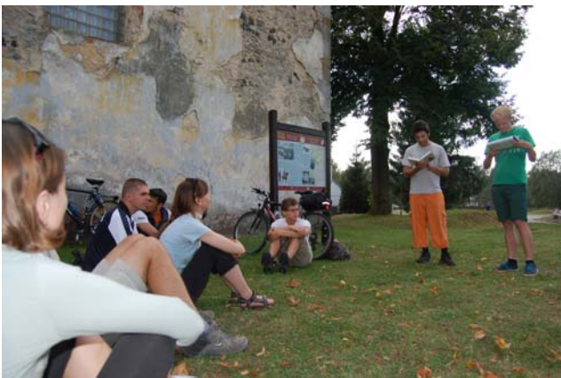
Die erschöpfte Truppe lauscht einem kreativen Vortrag aus Preußlers Buch

Die Reise beginnt im Grenzort Dolní Poustevna, der etwa 50 Kilometer östlich von Dresden liegt und in der