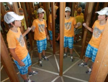
Vervielfachung von Teilnehmern