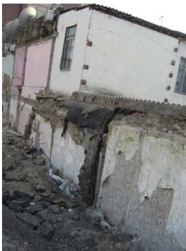
Wenn Wohnhäuser wichtigerem weichen müssen

Die Bakuer Innenstadt ist herausgeputzt, es glänzt und blitzt an allen Ecken und Enden. Fährt man nur 5km raus, so steht man vor Wellblechhütten, in denen die Menschen wohnen, die keinen Porsche fahren. Die Armen werden immer ärmer, die Reichen immer reicher ... und bauen mal schnell eine Multifunktionshalle für fast 150 Millionen Euro. Sie tun alles, damit sich Aserbaidshon und Baku dem europäischen Publikum als weltoffen, fortschrittlich und vor allem wohlhabend präsentieren können. Dafür werden die Häuser in unmittelbarer Nähe zur Crystal Hall abgerissen und die dort lebenden Menschen aus ihren Wohnungen vertrieben. Entschädigungszahlungen gibt es keine oder nur so geringe, die es den Betroffenen nicht annähernd erlauben, sich eine gleichwertige Wohnung in einem anderen Teil der Stadt zu suchen.